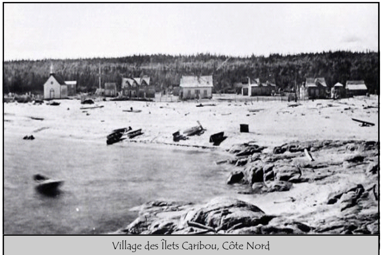
Village des Îlets Caribou, Côte Nord