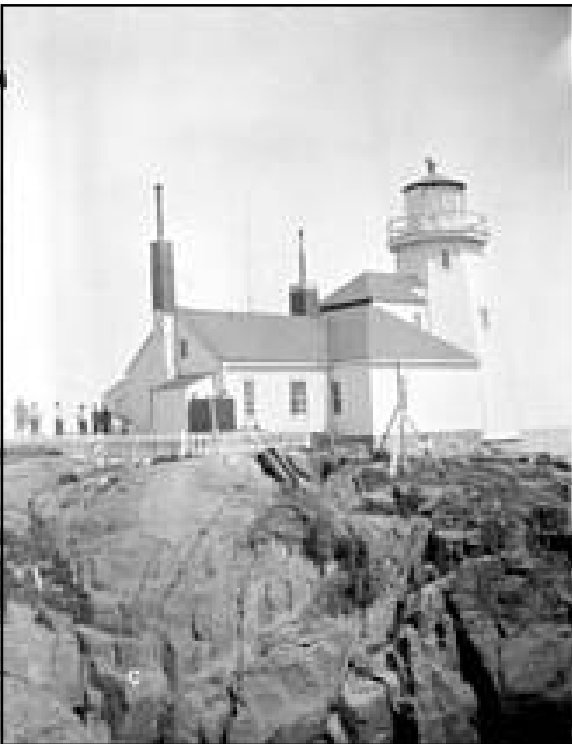
Phare de l'Île-aux-Oeufs