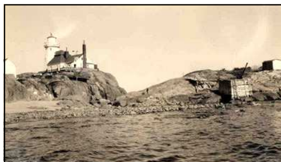
Phare de l'Île aux Œufs, Côte Nord, ANQ, 1921